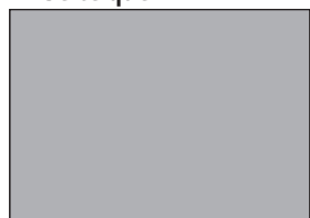
1/1 Seite quer